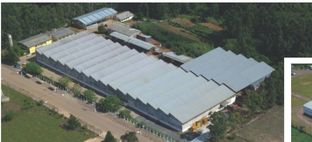
Unidade Gravataí - RS - Brasil