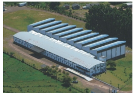
Unidade Santo Antônio da Patrulha - RS - Brasil